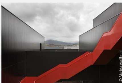
Globální výzkumné a vývojové středisko New Frontier | Španělsko Architekt: Sergio Baragaño

Hairexcel® technologicky těží z dalšího produktu od ArcelorMittal Construction – galvanického pokovení ZMevolution® , jehož patentované složení poskytuje vynikající ochranu proti korozi. Hledáte-li skutečně funkční ochranu objektu před nepříznivými klimatickými vlivy, je Hairexcel® nejlepší volbou.