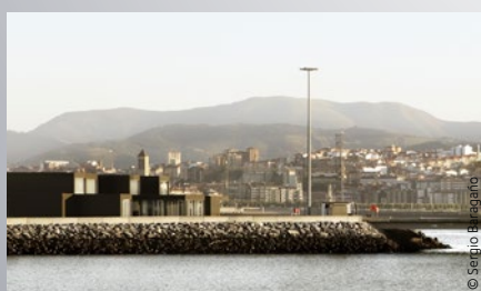
Plavební terminál Bilbao | Španělsko Architekt: Sergio Baragaño

Hairexcel® byl klasifikován ve třídě RC5 podle EN10169 pro ochranu proti korozi. Představuje ideální nátěr pro budovy s vyšší vlhkostí (tělocvična, bazén aj.) a lze jej aplikovat uvnitř i vně.