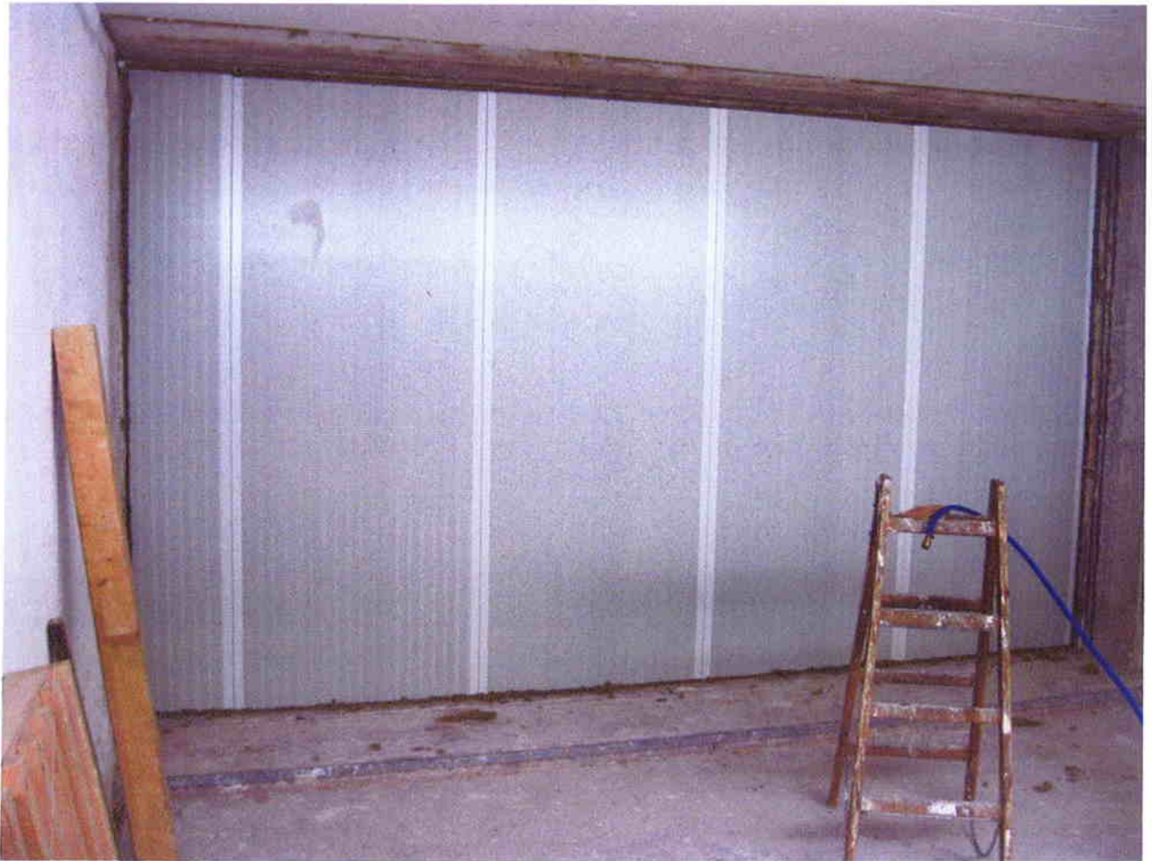
Abbildung 1: Gesamtaufbau der geprüften Wand aus Sandwichelementen, Ansicht Senderraum